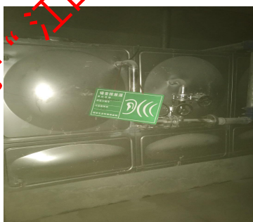
噪声排放源环保标识