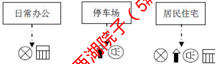
图2-2 施工期产污流程图