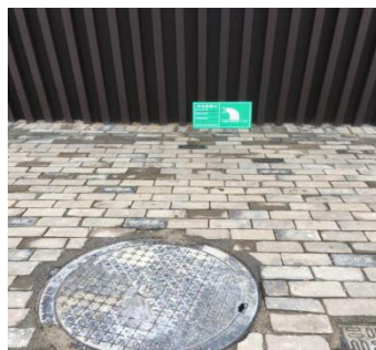
废水排放口环保标识