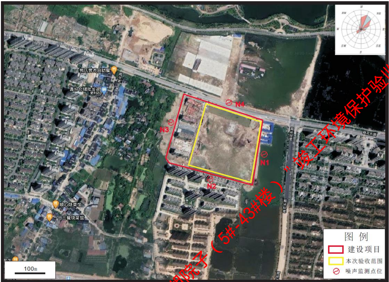
图6-1 噪声监测布点示意图