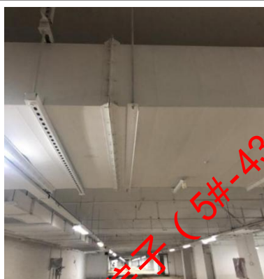
地下车库排烟管道