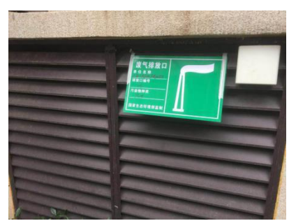
地下车库废气排放口环保标识