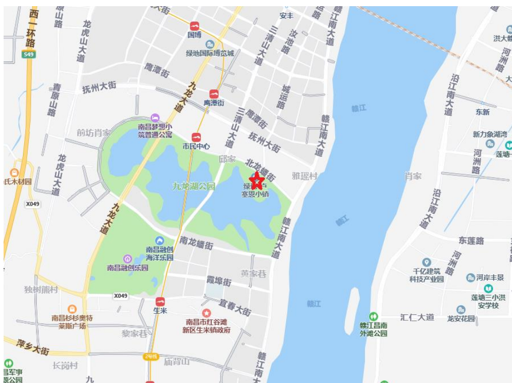
图 1-1 项目区地理位置图

绿地南昌国际博览城 JLH1302-C02 地块项目建设地点位于南昌市红谷滩新区北龙蟠街以南，九龙湖公园以北。地块中心地理坐标东经 115^{\circ}47'59.64'' 、北纬 28^{\circ}35'29.04'' 。详见下图 1-1 项目区地理位置图。