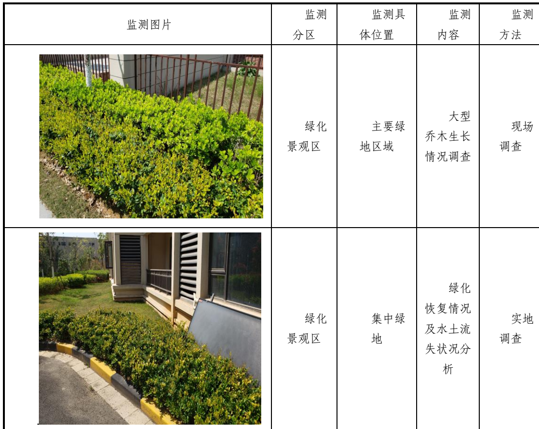
表 6-3 水土保持监测点位情况表