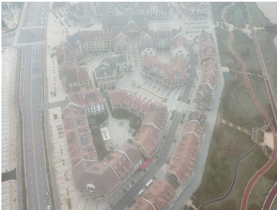
图 1-2 项目全景图（2020.2）